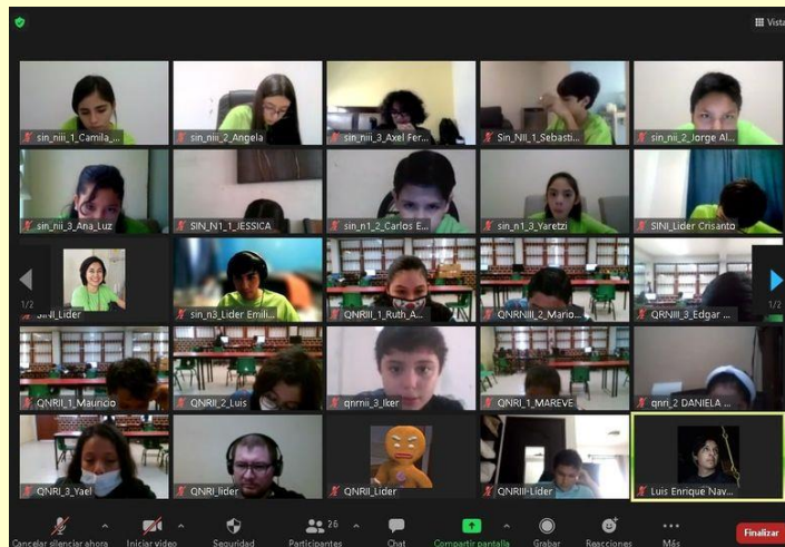
5to Concurso Nacional de OMMEB

El 35 Concurso Nacional de la OMM se llevará a cabo en noviembre de 2021