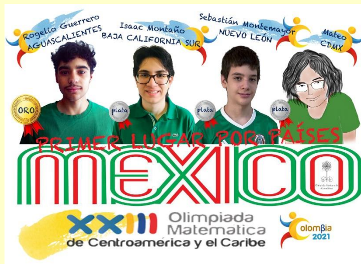
Resultado del equipo mexicano en la OMCC 2021