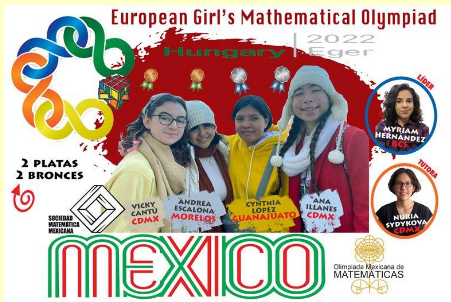
Resultado del equipo EGMO 2022