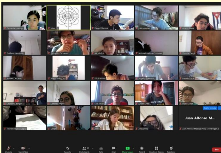
Cuarto entrenamiento de la OMM 2022, selectivos para la IMO y la OMCC

Olimpiada Mexicana de Matemáticas omm@ciencias.unam.mx http://www.ommenlinea.org/ Teléfono: (55) 5622-4864