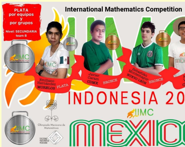
Equipo B de secundaria, IMC

1. Hasta el momento 26 estados del país han enviado su convocatoria estatal anual de la OMM para este 2022.